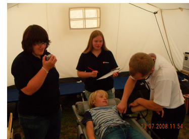
Auf dem OP-Tisch

Die Örtlichkeiten findet Ihr neben dem Sanitärgebäude. Der OP-Bereich befindet sich in einem SG 20 Zelt. Für die ganz schnellen Notfälle sind unsere Kameraden mit einem ELW und einem Gerätewagen vor Ort.