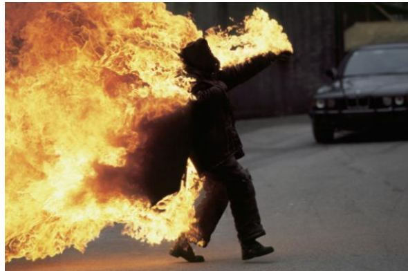
Darstellung brennender Personen