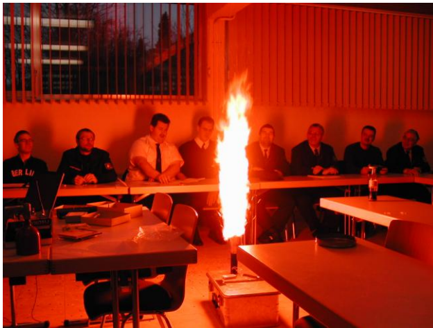
Abbrand-Versuche im Rahmen des Unterrichts